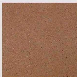
キャメルイエロー